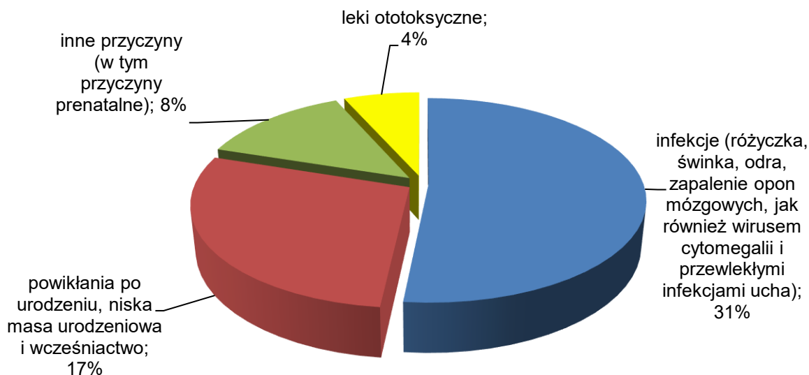
Rys. 1 Przyczyny utraty słuchu, którym można by zapobiec.

Według Światowej Organizacji Zdrowia w celu identyfikacji zaburzeń słuchu oraz wczesnego wykrycia nieprawidłowości w funkcjonowaniu narządu słuchu u dzieci koniecznością staje się wdrażanie szkolnych programów badań przesiewowych słuchu. 3