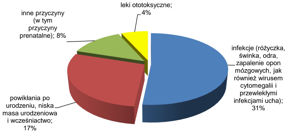
Rys. 1 Przyczyny utraty słuchu, którym można by zapobiec.

Według Światowej Organizacji Zdrowia w celu identyfikacji zaburzeń słuchu oraz wczesnego wykrycia nieprawidłowości w funkcjonowaniu narządu słuchu u dzieci koniecznością staje się wdrażanie szkolnych programów badań przesiewowych słuchu. 3