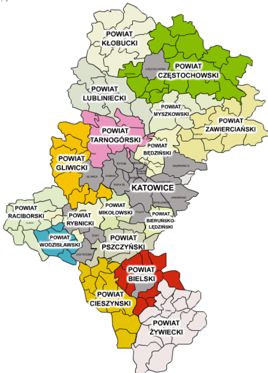
Rysunek 1 Lokalizacja powiatu bielskiego na tle województwa śląskiego

Powiat bielski leży w południowej części województwa śląskiego, tworząc wraz z powiatem żywieckim oraz powiatem cieszyńskim południowy obszar polityki rozwoju (Subregion Południowy) tego województwa. W centrum powiatu bielskiego znajduje się miasto Bielsko-Biała stanowiące odrębny powiat grodzki.