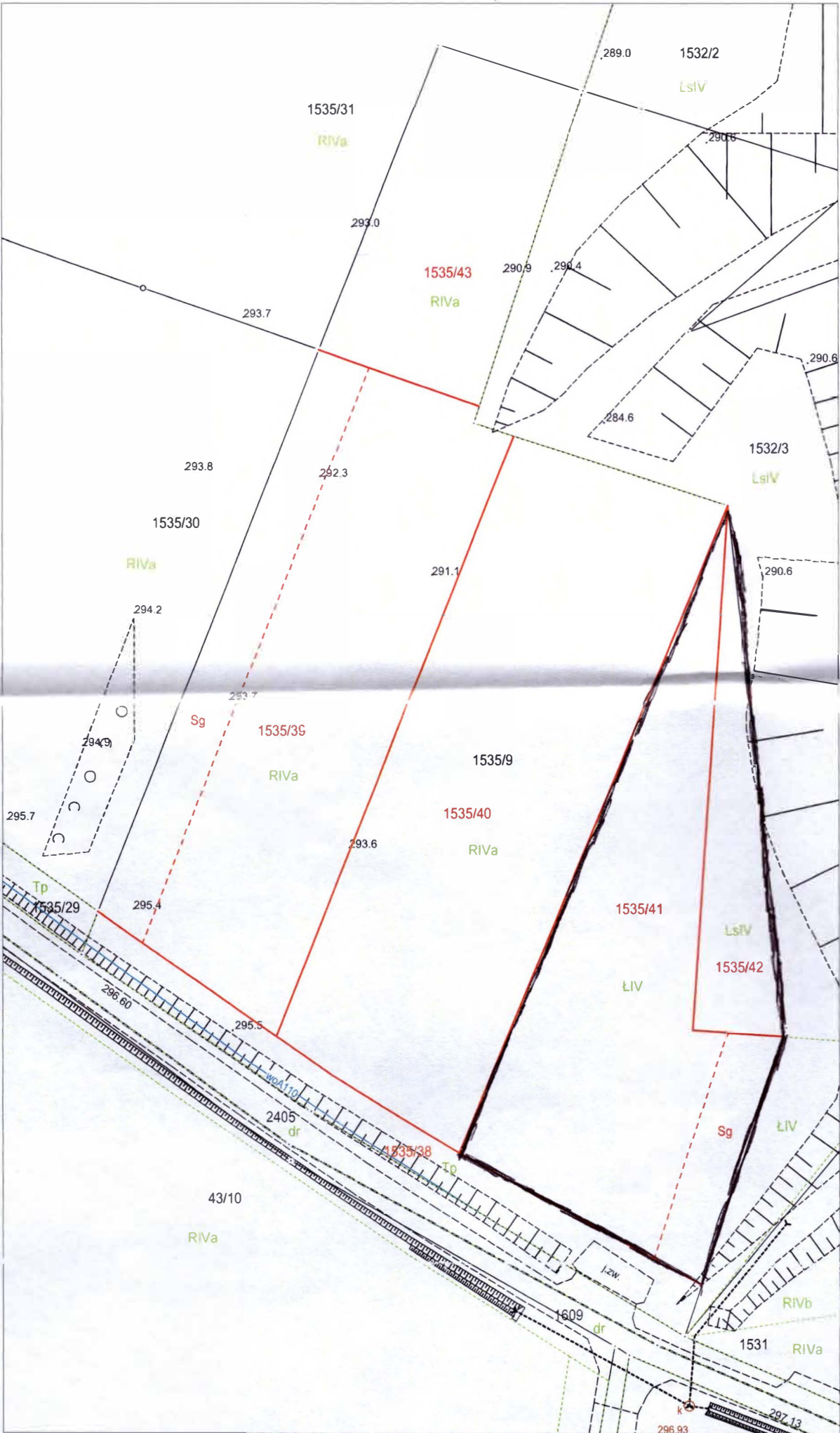
Mapa w skali 1:500 arkusz - sekcja 6.121.30.04.2.2

Proponuje się ustanowienie służebności komunikacji do nowoprojektowanej działki 1535/43 wzdłuż zachodniej granicy nowoprojektowanej działki 1535/39 pasem szerokości 5m. (oznaczone na mapie symbolem Sg) Proponuje się ustanowienie służebności komunikacji do nowoprojektowanej działki 1535/42 wzdłuż wschodniej granicy nowoprojektowanej działki 1535/41 pasem szerokości 5m. (oznaczone na mapie symbolem Sg)