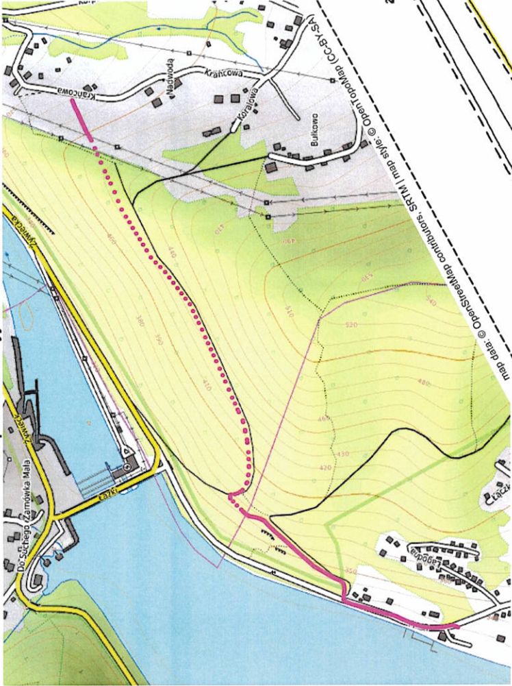
Mapa orientacyjna - skala 1:10 000