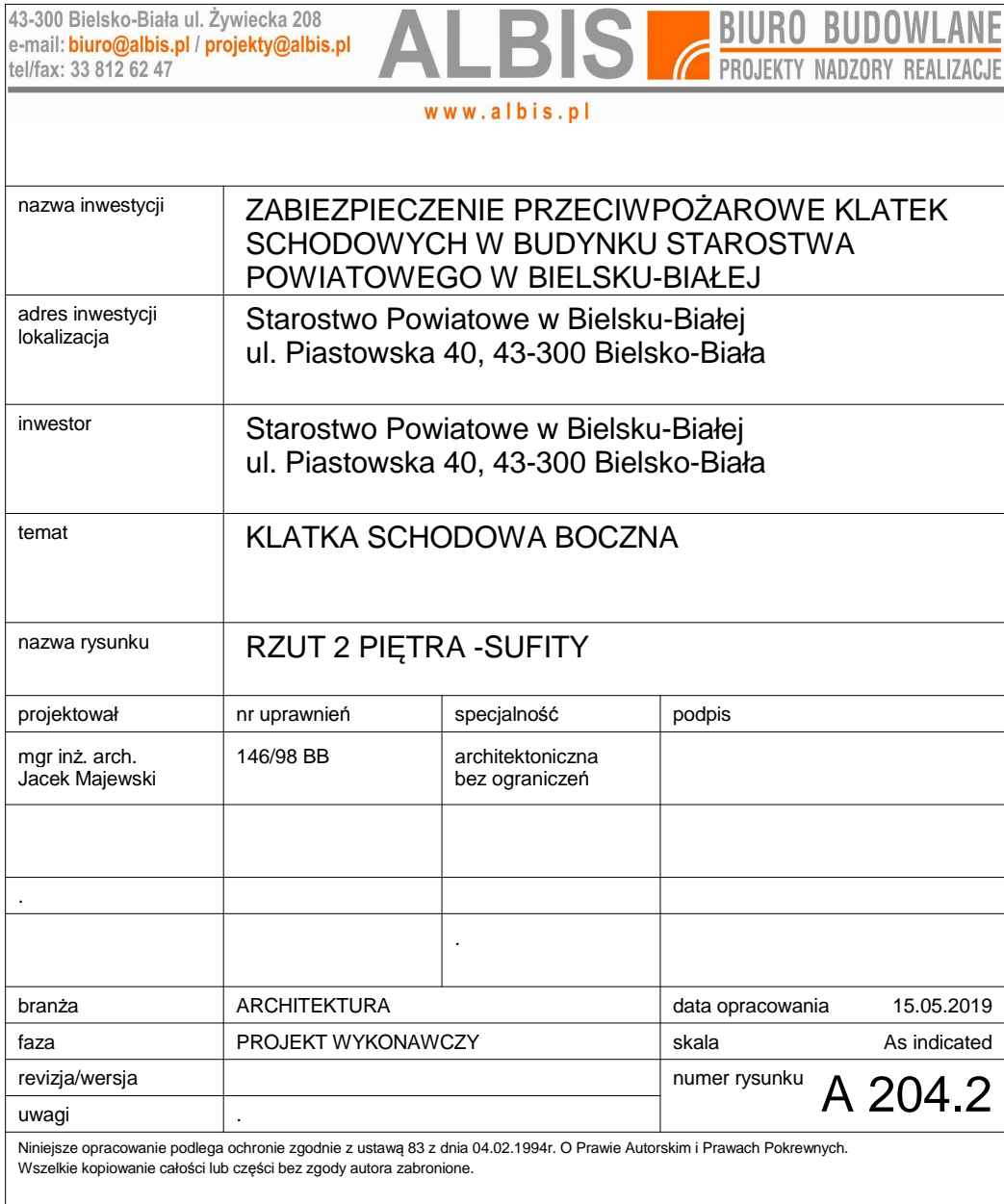
SCHEMAT 2 PIĘTRA -SUFITY skala 1 : 200