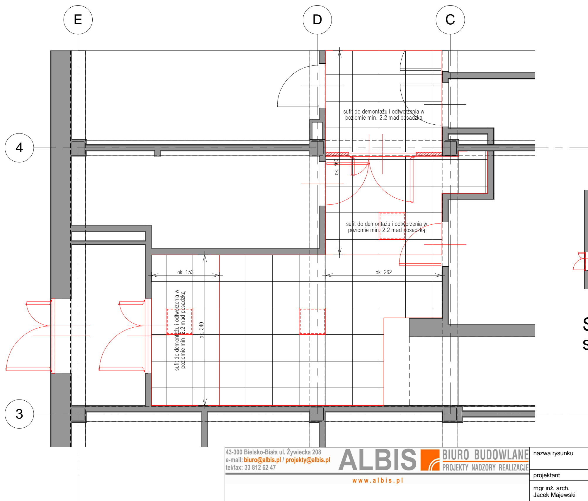
RZUT PIWNICY -SUFITY skala 1 : 50